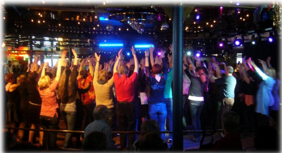
Risteily-yleisö sai keskiyön katrillin lisäksi riemukasta tanssiliikuntaa FolkJamissa.