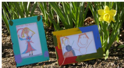
Yllä palkitut taulut

”Lyhyesti ja ytimekkäästi voisin sanoa, että oma Tanssi-päiväni sujui nopeasti ja kommelluksitta. Vietin liki koko päivän toimiston pöydän takana. Aamu meni viimeistellen osallistumispaketteja ja opastekylttejä. Kun kaikki ryhmät olivat saapuneet ja saaneet etukäteen tilaamansa osallistujamerkit, ruoka- ja työpajaliput, aika meni vastaillen mitä erilaisimpiin kysymyksiin. Meiltä toimistosta tultiin kysymään mm. mistä luontopolku alkaa, missä työpajat pidetään ja moneltako ne alkaa, saako hyppynaruja ja puujalkoja lainata, missä voi silittää kansallispuvun essua, missä on katselmuksen harjoitukset, saako katselmuksessa katsoa toisten ryhmien esitykset jne. Kysymyksiä