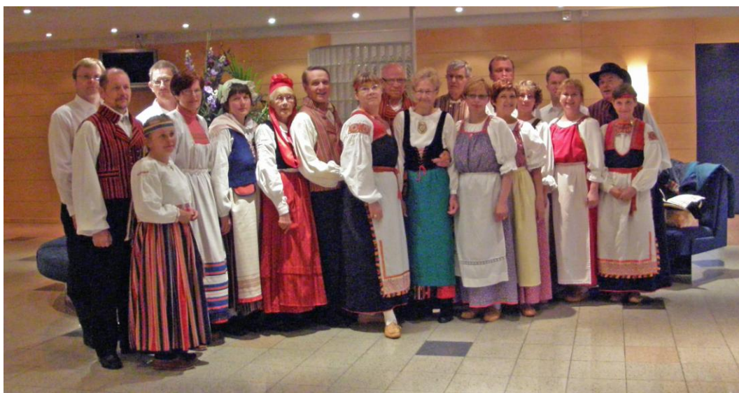
Jäähdyttelijät ja Piirinki esiintyivät Rantasipi Sveitsissä Laurean ammattikorkeakoulun järjestämässä kansainvälisessä konferenssissa