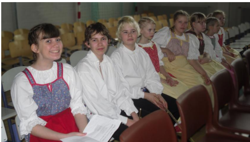
Rikurillat odottaa vuoroaan