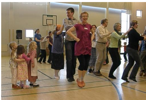
Illanvietossa jaksettiin tanssia letkajenkkaa – niin isot kuin pienetkin