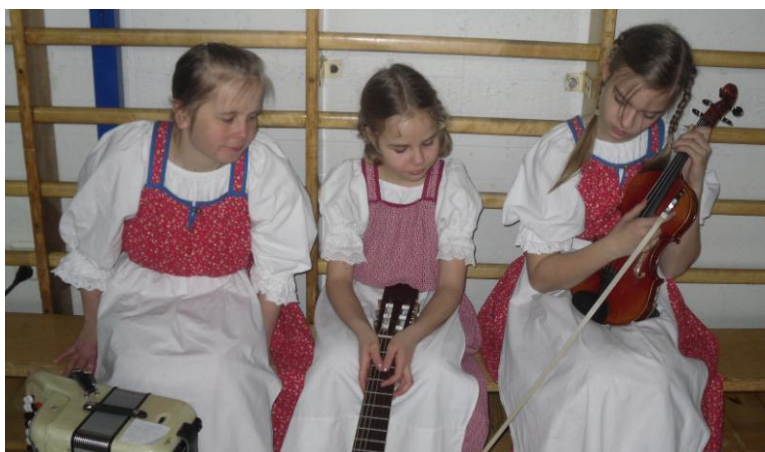
Bordunan tytöt mietteläänä

Pajat olivat onnistuneita. Huovutuksesta ja kantelepajasta tykättiin kovasti. Saammekohan jossain kohtaa kuulla kantelepajan hedelmiä...? Myös pihalle oli suunniteltu toimintaa. Karjalaisuus näkyi ja kuului koko ajan.