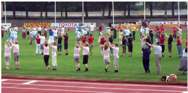
Piirinki kenttäharjoituksissa Göteborgissa 2006, sillä kertaa helteessä.

Toivon teille kaikille huikeita kokemuksia tulevalta vuodelta ja siihen alle monia hikisiä harjoituksia!